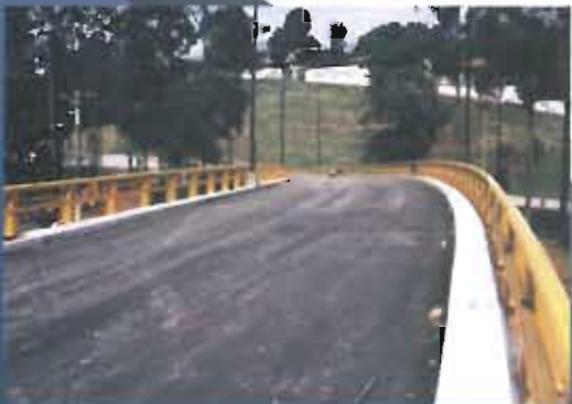
Interchange at Carrera 52 with Calle 63 (SEDECO). Itagüí, Antioquia