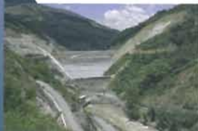
Porce III hydroelectric project technical, economical, and environmental feasibility studies.