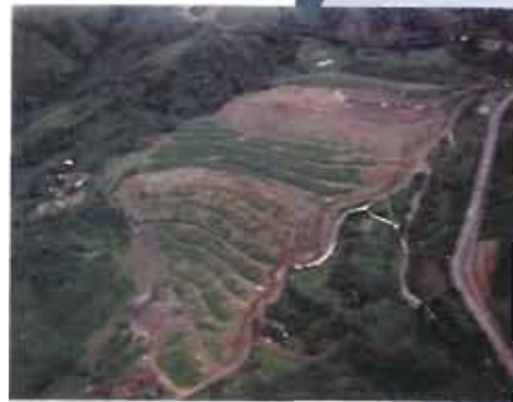
Relleno Sanitario Curva de Rodas. Medellín - Antioquia.