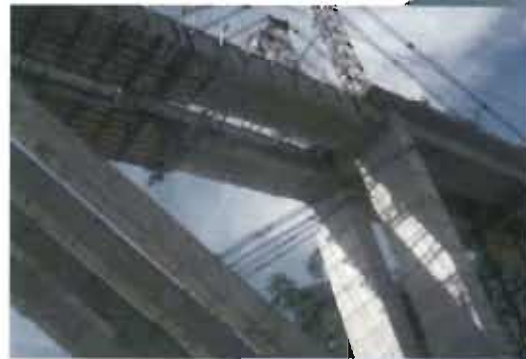
Bridge over Nare River at Puerto Islltas. Troncal de la Paz highway, Antioquia.