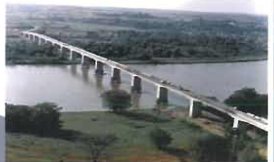
Bridge over Cauca River, Caucasia, Antioquia.