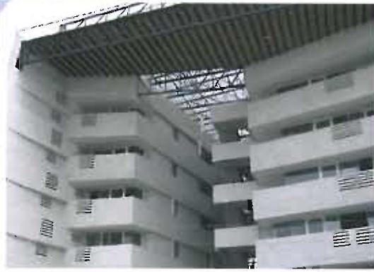
Urabá's Chamber of Commerce Building, Apartadó, Antioquia.