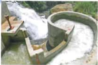
Proyecto Multipropósito Agua Fresca