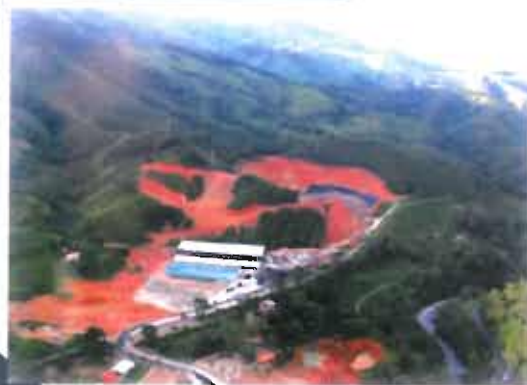
La Pradera Landfill. Don Matías, Antioquia.