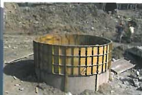
Alcantarillado en cuencas sanitarias de Medellín - Antioquia.