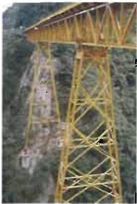
Rehabilitación puente Cajamarca. Tolima