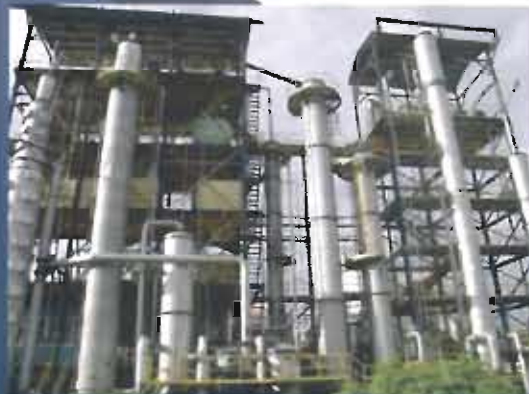
Ingenio Sugar Mill for the Agro-industrial Complex of Northwestern Antioquia (PANA), Vegachi, Antioquia.