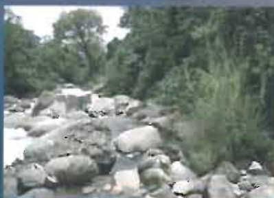
Río Frio hydroelectric project.