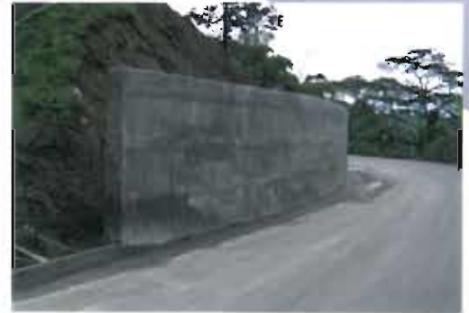
Puente sobre el río Cauca. Caucasia - Antioquia.