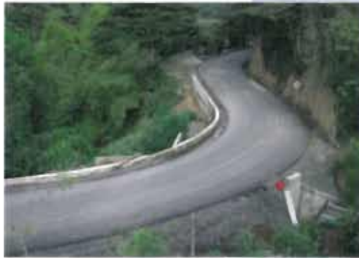
Reconstrucción y pavimentación. Programa de Infraestructura Vial Plan 2500