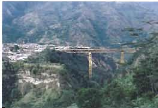
Rehabilitation of the Cajamarca Bridge. Cajamarca, Tolima.