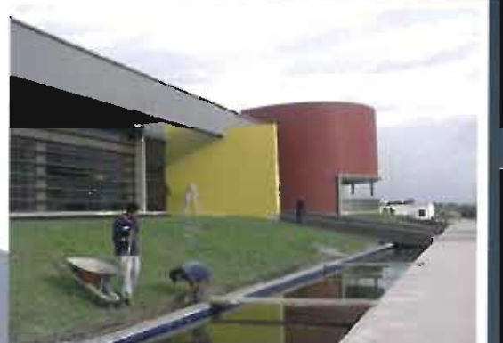
Metal Works Industrial Complex. Miranda, Cauca.