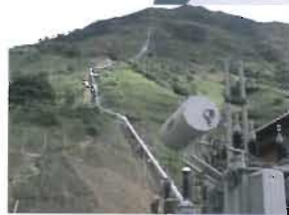
Proyecto Hidroeléctrico Montañas. Don Matías - Antioquia.