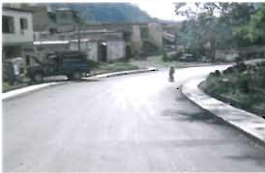
Supervision for the construction of the El Cinco Venecia - Bolombolo project.