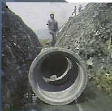
Alcantarillado en cuencas sanitarias de Medellín - Antioquia.