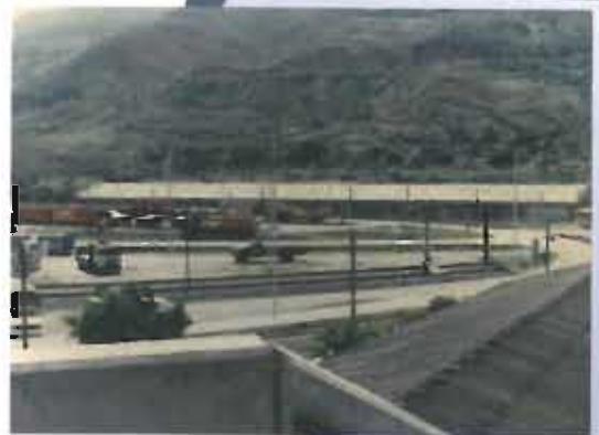
Medellín's Metra Headquarters. Bello, Antioquia