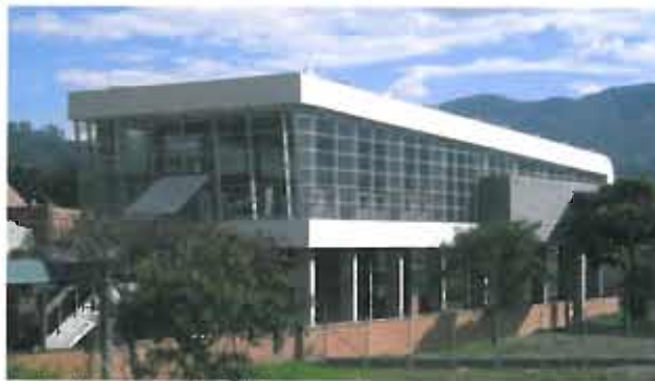
Itagüí Station for Medellín's Metro railway system. Medellín, Antioquia