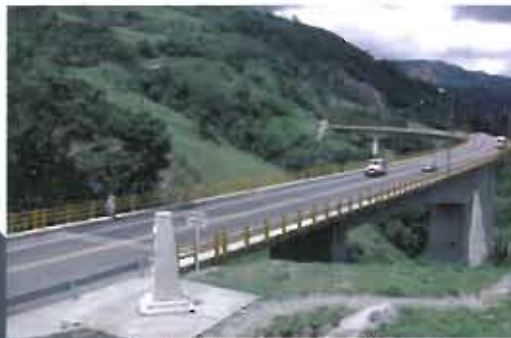
Pipiral Viaduct. Road from Bogotá to Villavicencio.