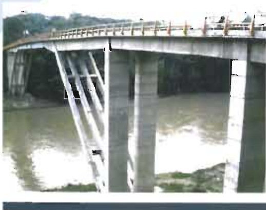
Puente sobre el río Nare en Puerto Islltas. Troncal de la Paz - Antioquia