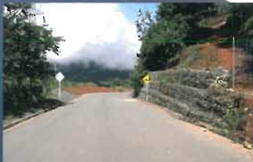
Vía Simón Bolívar - Anchicaya. Anágua via a Buenaventura, Occidente del Valle del Cauca.