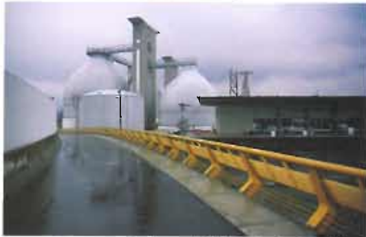
San Fernando Wastewater Treatment Plant. Itagüí, Antioquia