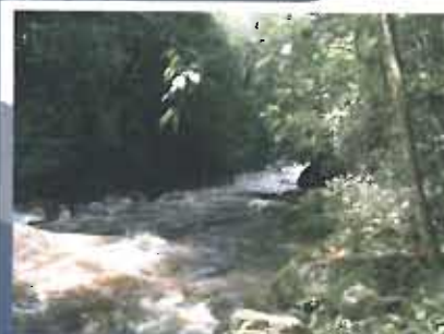
Ambeima River hydroelectric project.