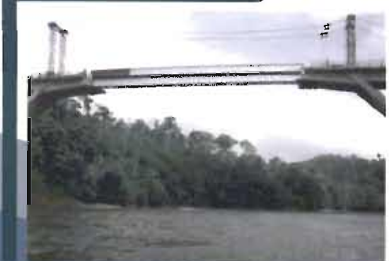
Bridge over Nechí River at Puerto Triana. Troncal de la Paz highway, Antioquia.